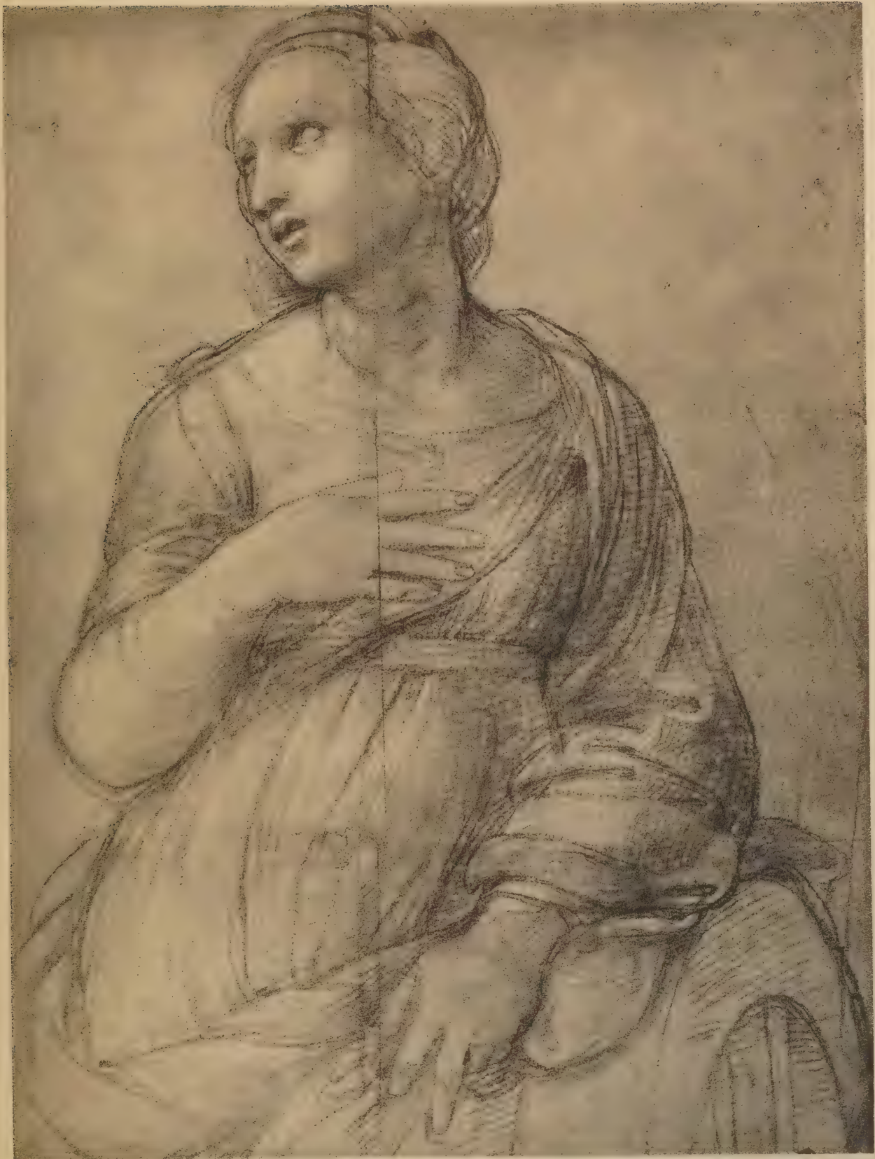
Sainte Catherine d'Alexandrie